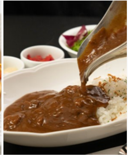
特製カレー ¥1,980 (税込)

旬のごろごろ野菜をとことん味わえる、野菜の旨味を凝縮したトマトベースの Pasta。