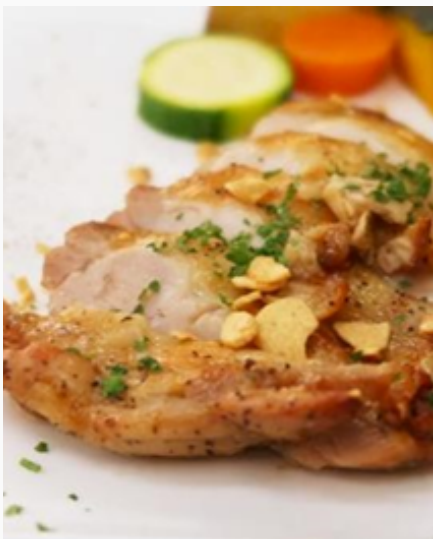
チキンソテー パン / ライス付 ¥1,980 (税込)

一番人気。スパイスと野菜を長時間煮込み、スパイスの香りが生きたコク深いアビタ特製カレー。