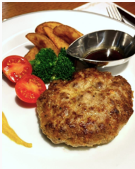
北海道和牛使用 ハンバーグセット パン / ライス付 ¥1,980 (税込)

カリッとジューシーに焼き上げたチキンソテー。醤油ベースの香り高いソースを添えて。