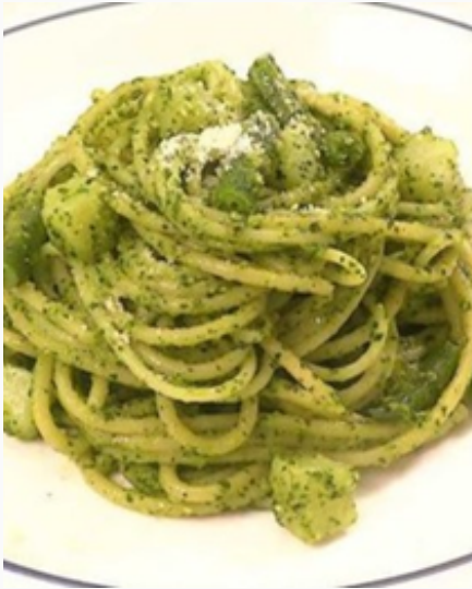
ジェノベーゼ ¥1,700 (税込)

( Breakfast 7:00-10:30 / Grand Menu 10:30 ~ / Food L.O. 22:00 / Drink L.O. 22:30 )