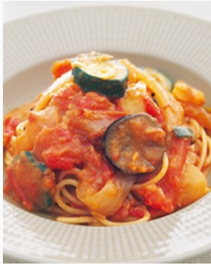
野菜のカポナータ ¥1,700 (税込)

バジル、ナッツ、ゴルゴンゾーラチーズなどでコク深く仕上げ、爽やかなレモンと香りづけの白ワインが特徴の Pasta。